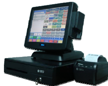
PUNTO DE VENTA